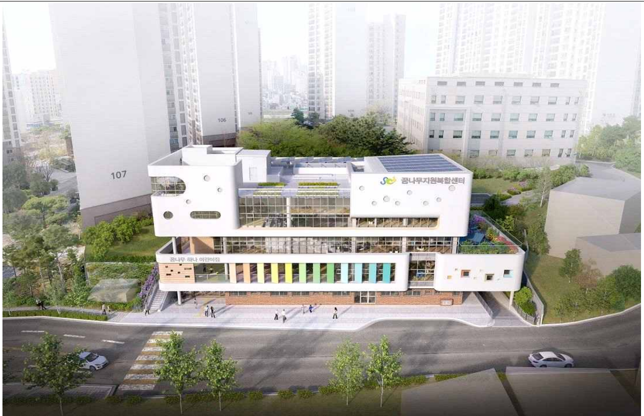
조 감 도